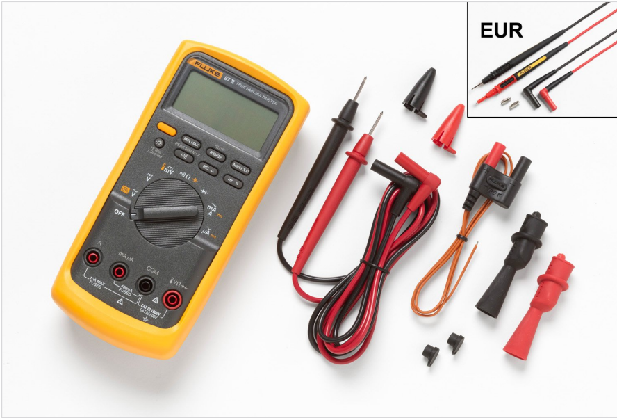
Fluke 87-V/C Fluke 87-V/C 工业用真有效值数字万用表