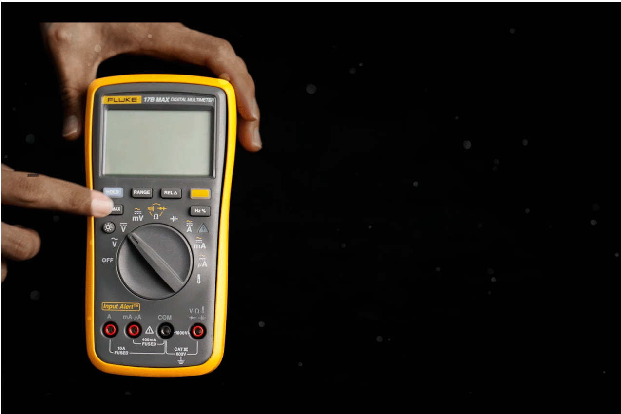
产品规格: Fluke 17B MAX 数字万用表